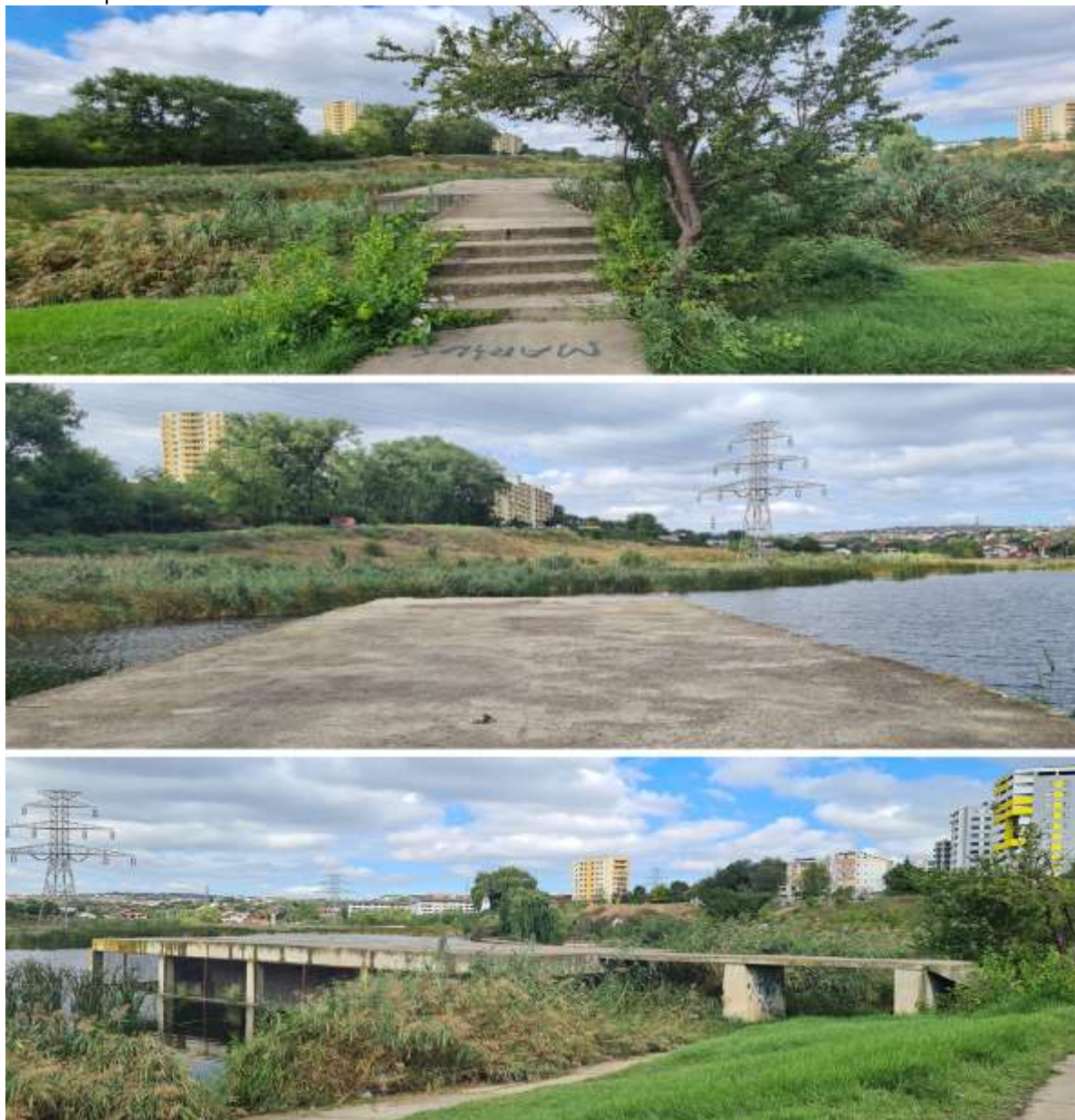
Figura 9. Ponton existent și potențială perspectivă

Amplasamentul pontonului oferă un centru major de interes putându-se amenaja pe acesta o platformă cu vedere belvedere, iar în jurul acestuia diferite pontoane cu acces la hidro biciclete.