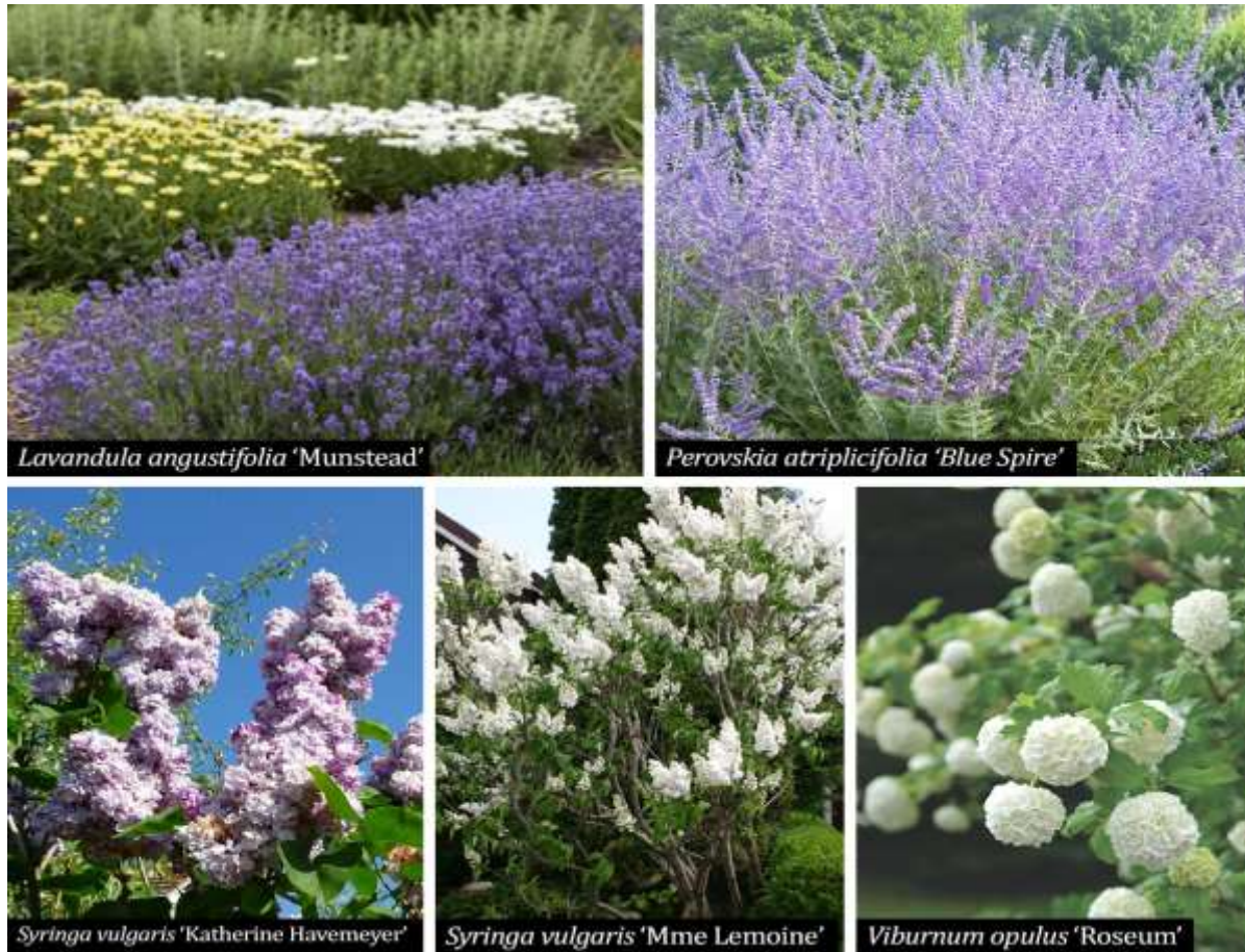
Figura 13. Specii de arbuști și subarbuști foioși propuși