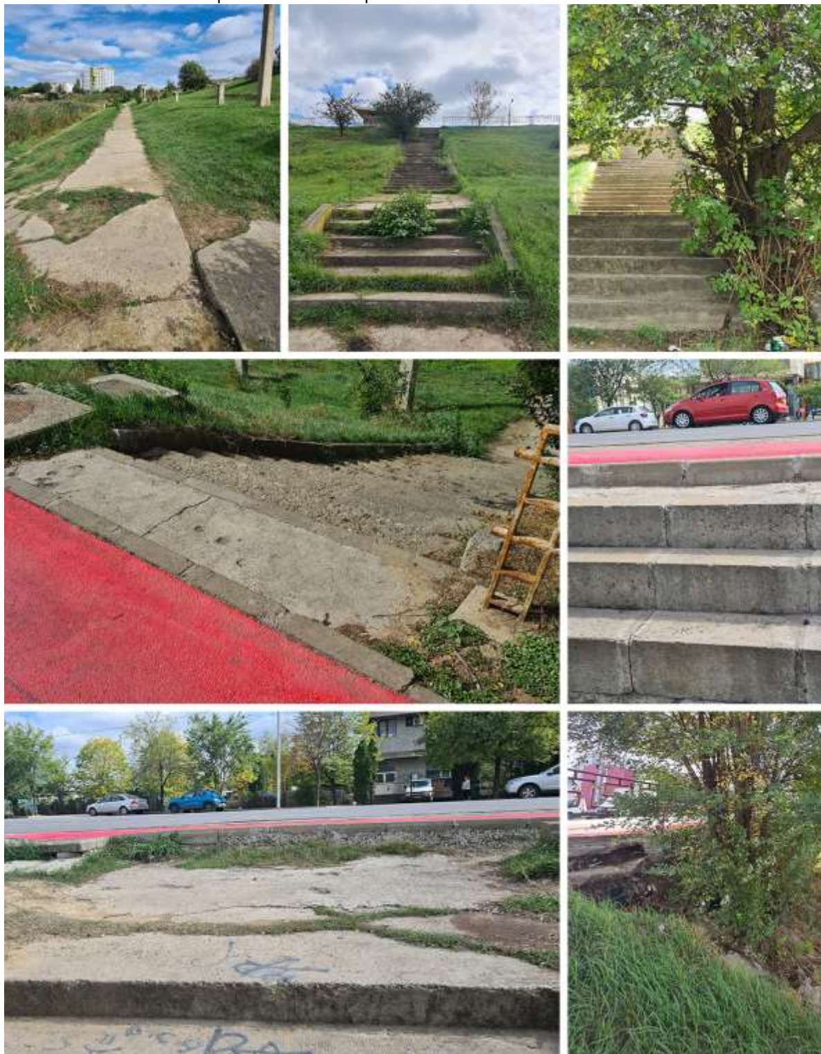
Figura 7. Situația aleilor și acceselor pietonale

Aleile și treptele (figura 8) existente sunt puternic deteriorate astfel putând provoca diferite accidente fiind greu accesibile. De asemenea, aspectul acestora a devenit inestetic datorită întreținerii deficitare și a plantelor crescute spontan în crăpăturile acestora.