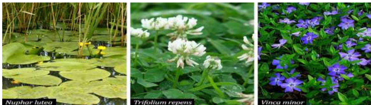
Figura 18. Specie acvatică propusă și specii acoperitoare de sol

Este o plantă perenă, cu tulpini târâtoare, cu frunze ovale, lucioase, verzi și pe timpul iernii. Înfloarește în luna aprilie și face flori albastre. Preferă locurile umbroase unde formează pâlcuri compacte. Este folosită ca plantă acoperitoare de sol.