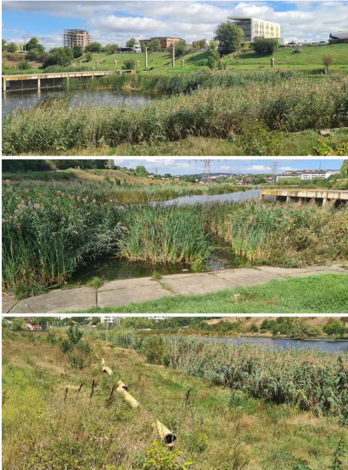
Figura 3. Vegetația spontană din jurul lacului

Pentru a determina calitatea, vechimea și structura fondului arboreol a malului Lac CUG II, s-a recurs la realizarea studiului dendrologic asupra vegetației existente, pe toată lungimea versantului.