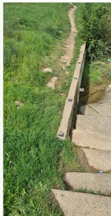
Figura 8. Izvorul existent