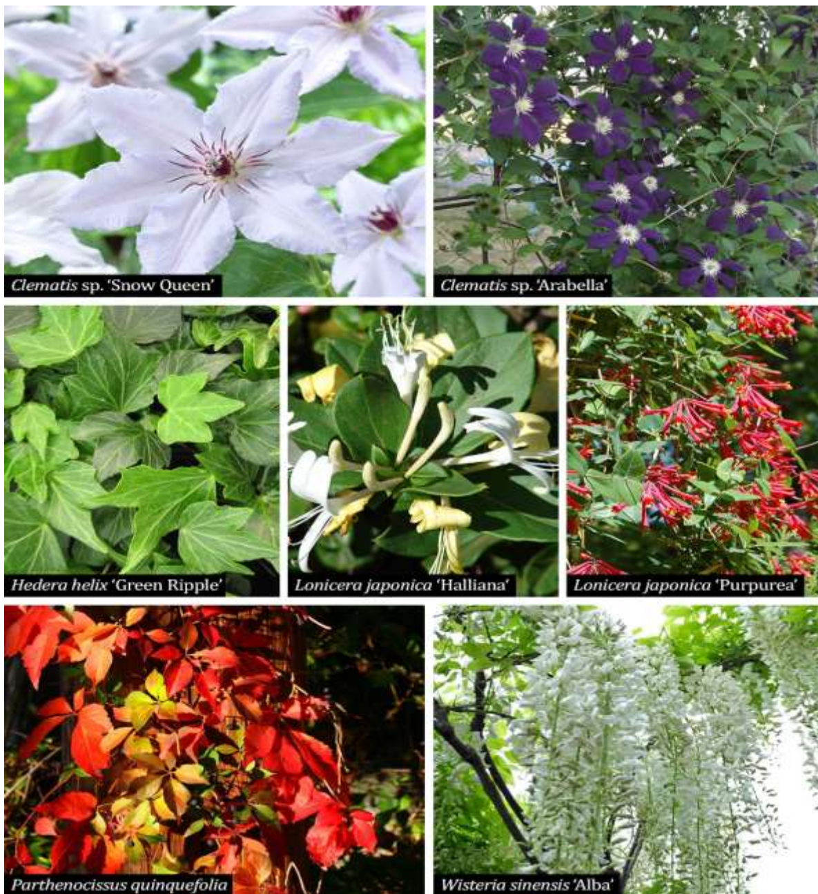
Figura 17. Plante cățărătoare și volubile propuse

Este o liană originară din Japonia. La maturitate atinge o înălțime de aproximativ 10 m. Înflorește în Aprilie, dar în funcție de vreme poate înflori și în luna Septembrie. Este decorativă prin florile sub forma unui ciorchine de culoare alb, albastru și roz. Se pretează la toate tipuri de sol și se poate planta la soare sau semi umbră.