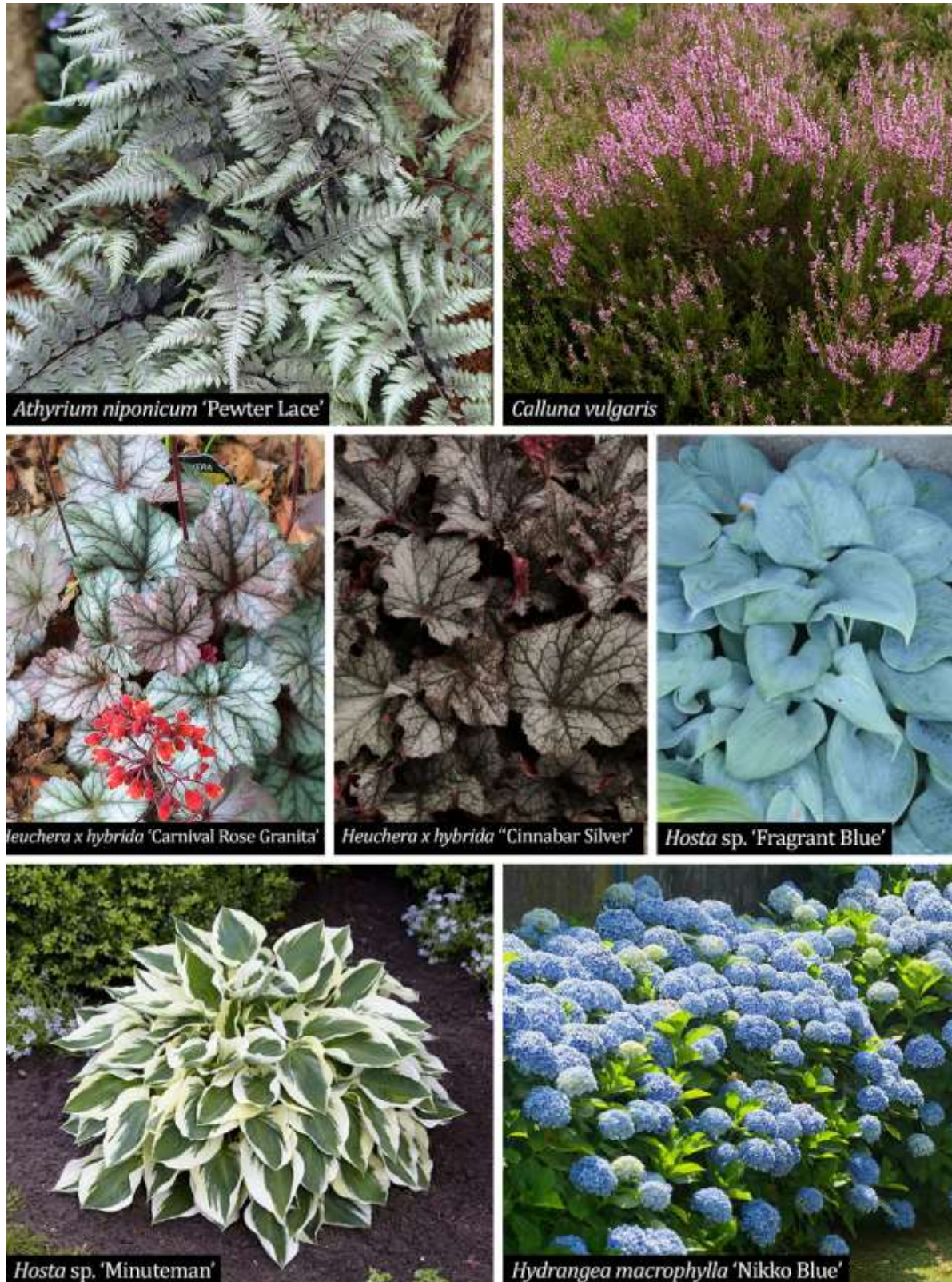
Figura 14. Specii perene de umbră și semi-umbră propuse

dimensiuni mai mici față de alte varietăți, poate fi folosit în spații mici, ghivece, borduri sau ca și accente în amenajări.