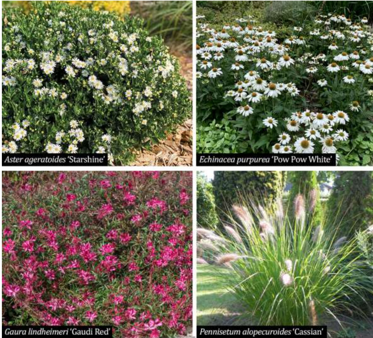
Figura 15. Specii perene iubitoare de soare