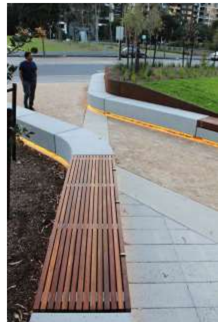
Fig. 9-10 – Exemple asemănătoare cu modul de organizare a gradenelor (spațiu verde, locuri de stat, colectare deșeurilor, iluminare banda led)