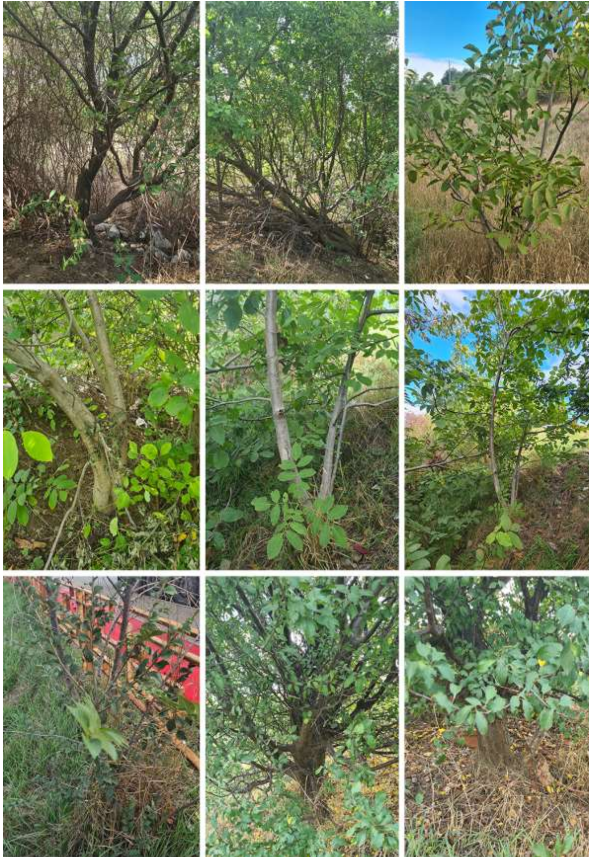
Figura 5. Exemple de arbori ce au suferit tunderi ale trunchiului în faza de puiet