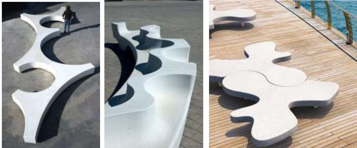
Fig. 6-7-8 – Exemple asemănătoare pentru locurile de stat propuse pe pontoane.

1. Locurile de stat din zona pontoanelor amplasate pe terenul propus pentru amenajarea parcului sunt dotate cu locuri de stat ce pot si accesate de pe ambele parti, atat de pe ponton, cat si din parc.