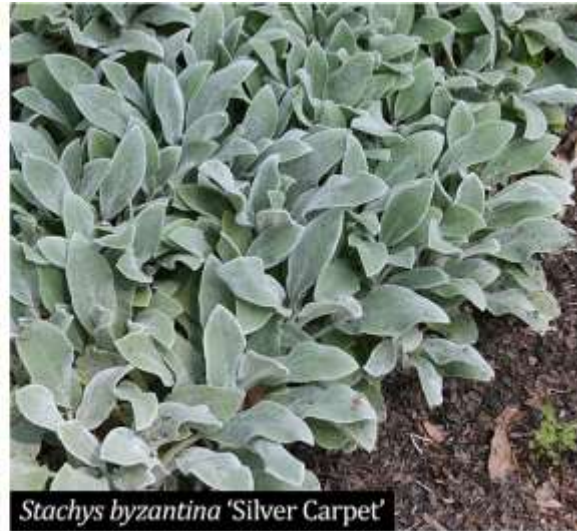
Stachys byzantina 'Silver Carpet'