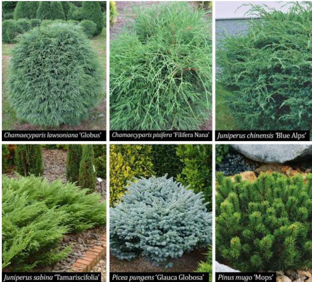
Figura 11. Specii de arbuști rășinoși propuși