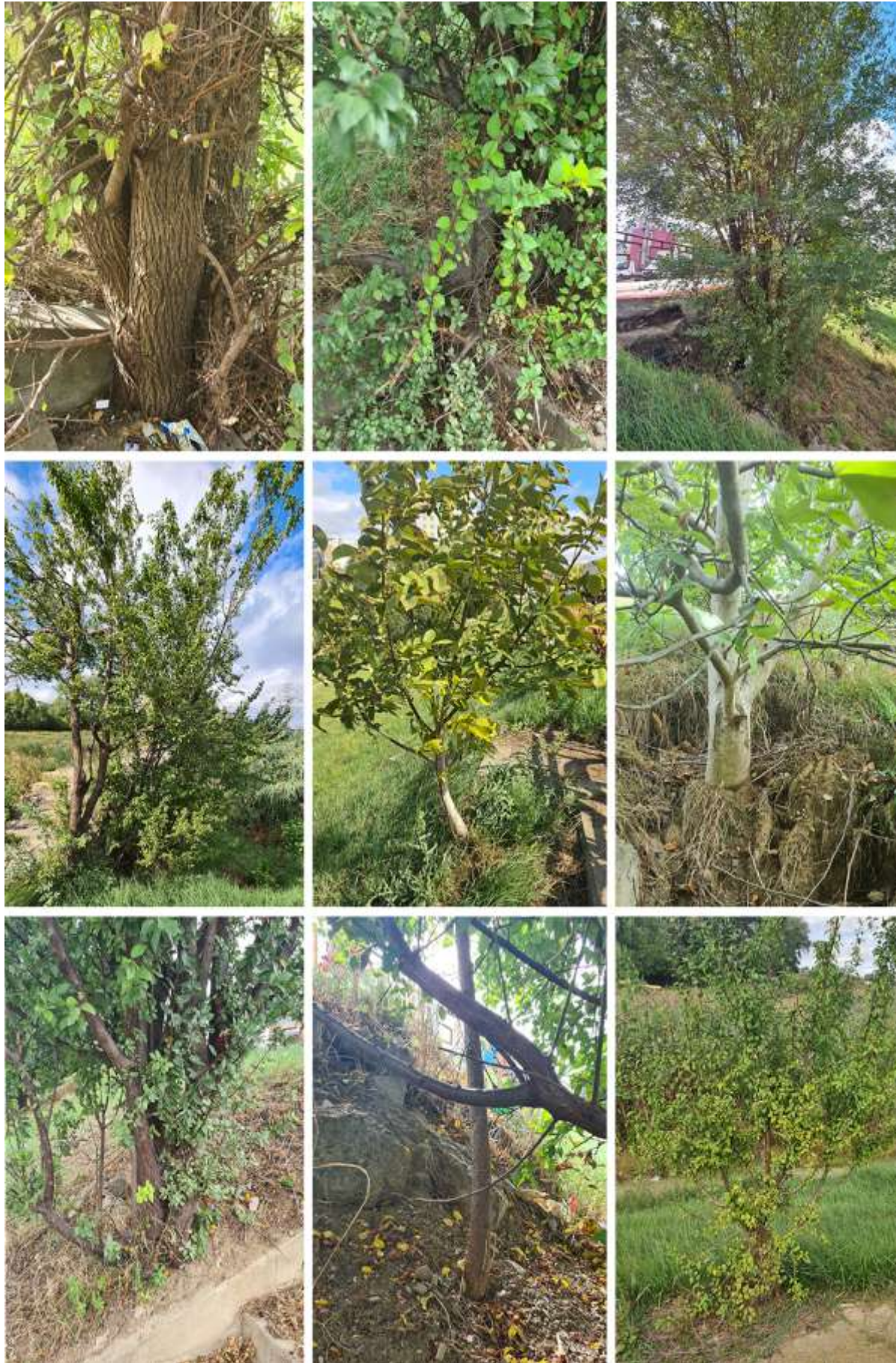
Figura 4. Creșterea arborilor în locuri necorespunzătoare