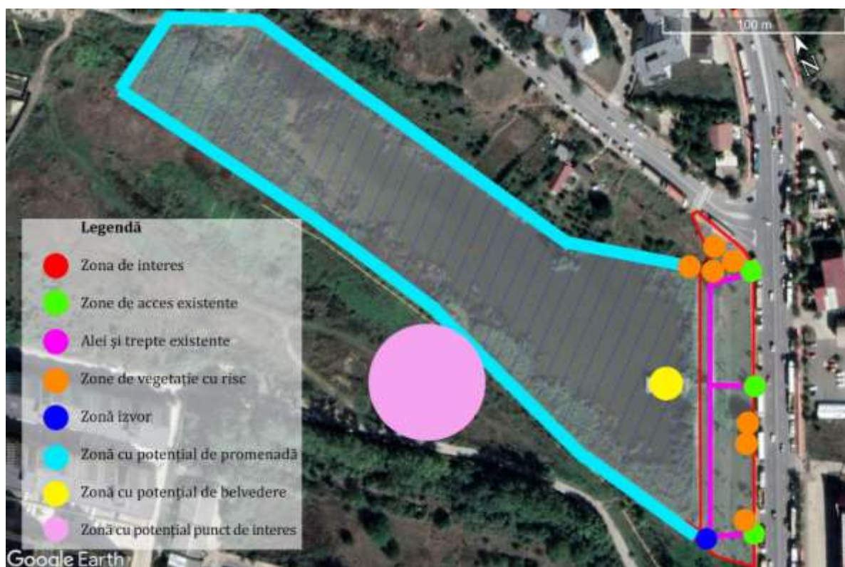
Figura 6. Analiza situației existente - plan

Accesul principal pe versantul barajului oferă posibilitatea de creare a unei perspective vizuale. Acest lucru putând fi accentuat cu ajutorul pontonului existent ce dirijează privirea pe malul lateral al lacului, mal ce prezintă un mare potențial din punct de vedere peisagistic.