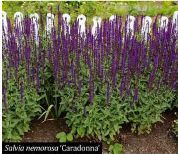
Salvia nemorosa 'Caradonna'