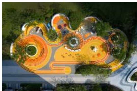
Fig. 11-12 – Exemple asemănătoare cu modul de organizare propus pentru locul de joacă

- planul de execuție, cuprinzând faza de construcție, punerea în funcțiune, exploatare, refacere și folosire ulterioară;