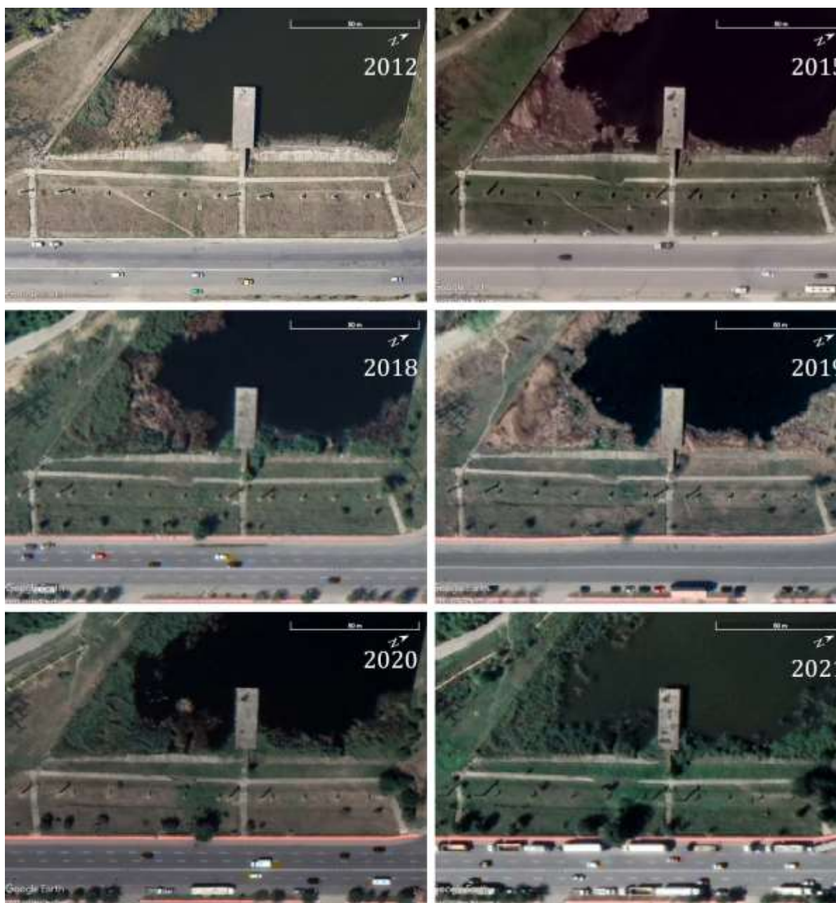
Figura 2. Imagine de satelit Google Earth (2012 - 2022)