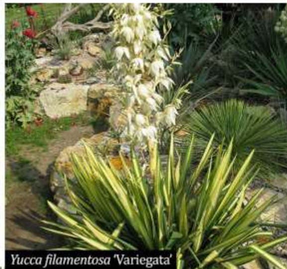
Yucca filamentosa 'Variegata'