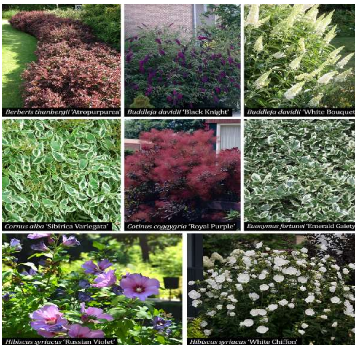
Figura 12. Specii de arbuști foioși propuși

Creșterea sa compactă îl face excelent pentru pantarea în diverse grupuri de plante, tufe individuale, garduri vii de talie mică, containere, terase, grădini, parcuri etc.