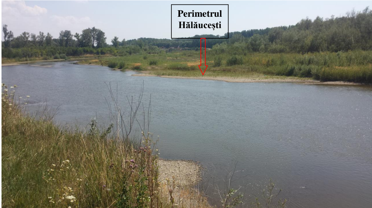
Aspectul perimetrului “HĂLĂUCEȘTI”

Prin extragerea agregatelor minerale pe amplasamentul analizat se va reduce procesul de eroziune activă a malurilor râului Siret, creându-se astfel condiții pentru menținerea suprafeței habitatului pădure de luncă.