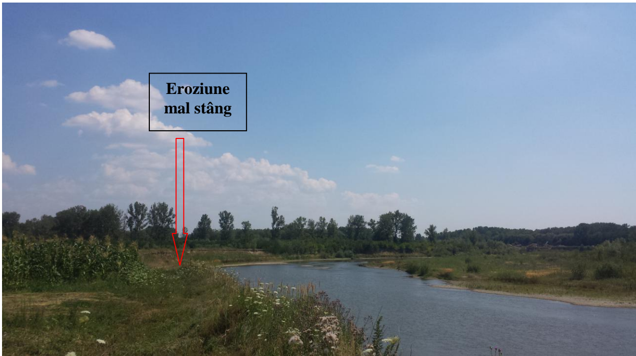
Eroziunea malului stâng opus perimetrului “HĂLĂUCEȘTI”